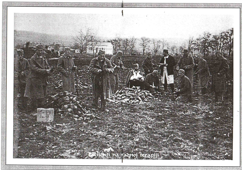
Пацијенти на радној терапији